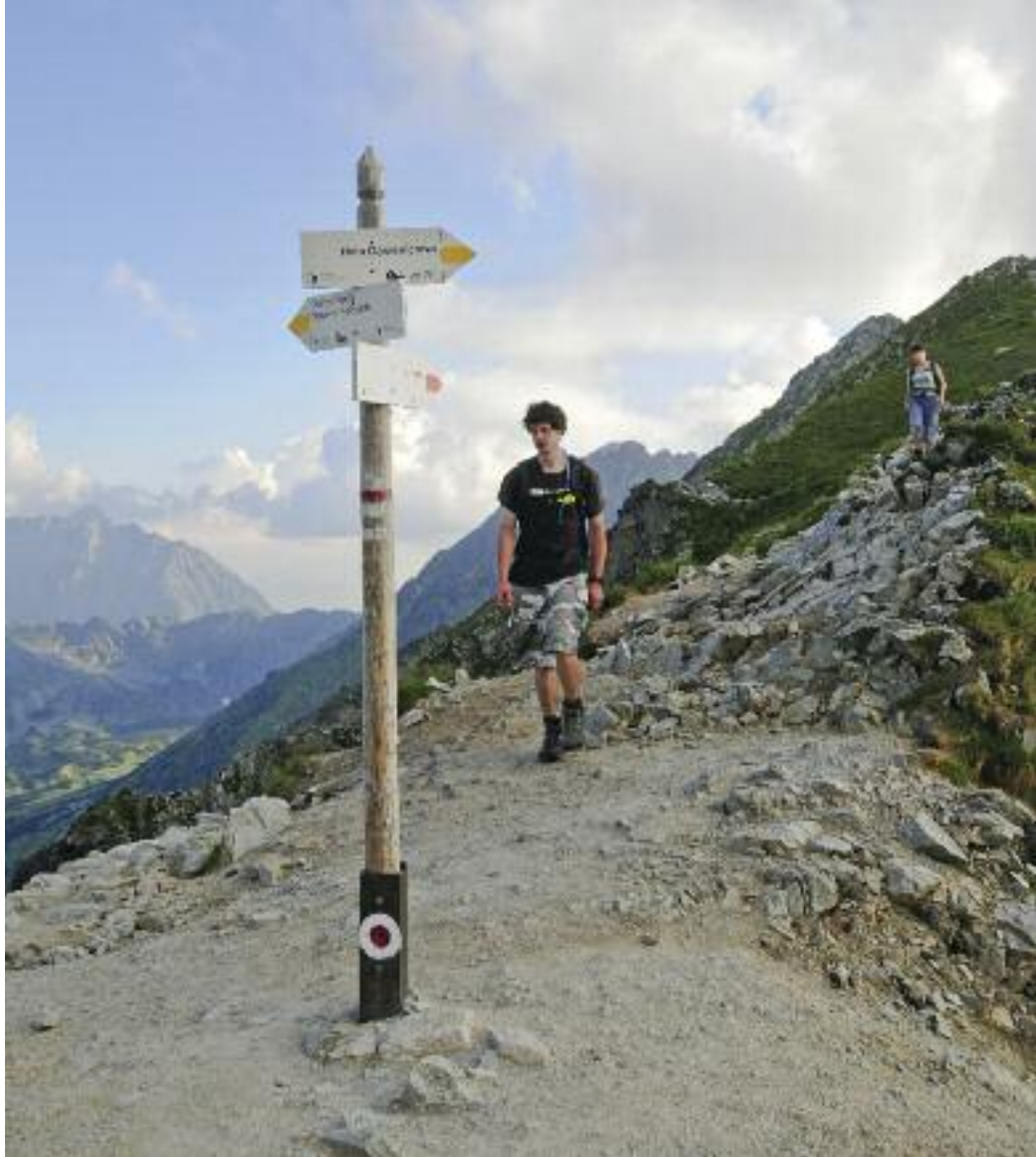
Przełęcz Krzyżne (2112 m n.p.m.) – koniec wieńczy dzieło

Dobra, koniec tej jeremiady i gderaniny, bo jeszcze naprawdę wyjdzie na to, że na Orlej można się nabawić tylko odcisków,